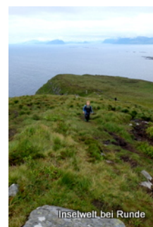
Inselwelt bei Runde

wären wir wahrscheinlich aufgrund des Regens heute schon abgereist. Aber es war gut, das wir es nicht gemacht haben.